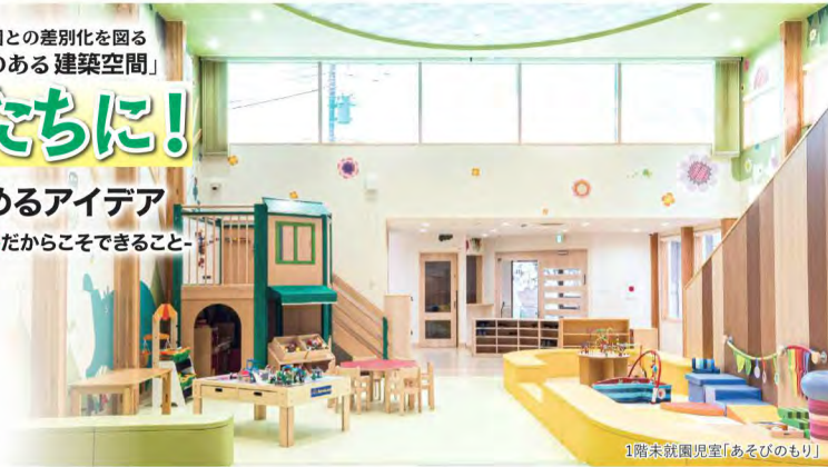
1階未就園児室「あそびのもり」