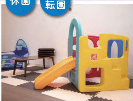
園の経営者に求められることは？

職員集団も、保育の専門家であり、正に今、園に在籍する園児や保護者に保育・教育を行うことへの大きな責任感を持ち、日々保育にあたっています。その職員集団に、園が休園等になってもやむなし、園児や保護者にはものすごい迷惑をかけるが、それを押ししてもなお、これ以上は我慢できない、このままその状態の園が継続することの方が問題が大きい、と決心させるほど、経営サイドと職員集団の間に溝ができてしまった、ということです。年度の途中でそのような事態になるケースはよほど深刻な状況と伺えます。