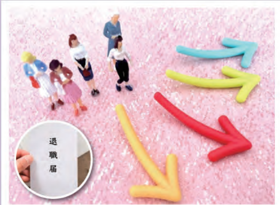
職員が一斉に退職すると…